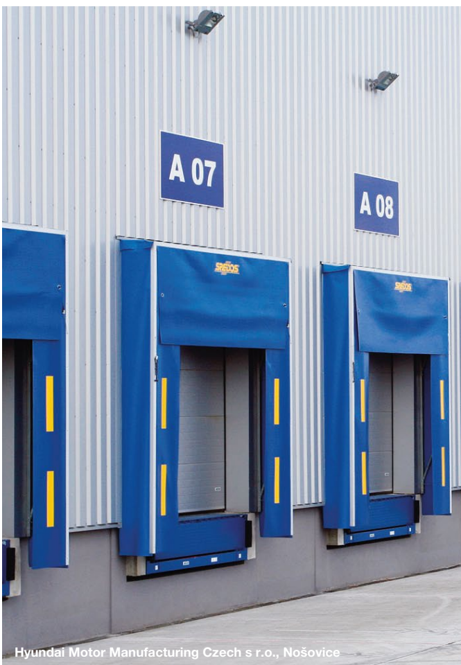
Hyundai Motor Manufacturing Czech s r.o., Nošovice